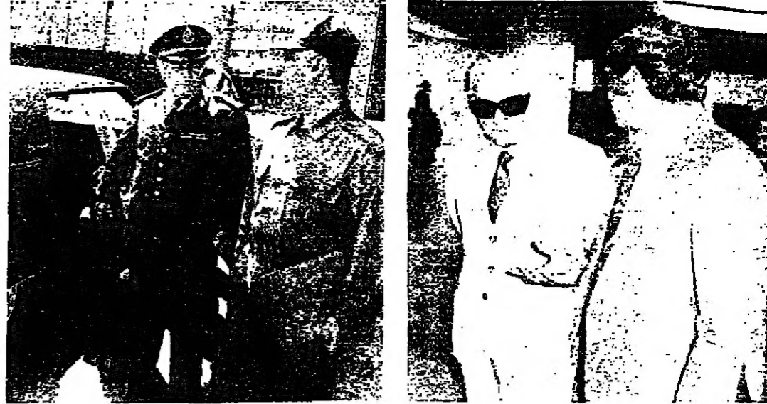
الرئيس شمعون في بيعدا .. في حديث مع القائد الجيش العماد سميد عند دخل القصر القاب طارق حيشي